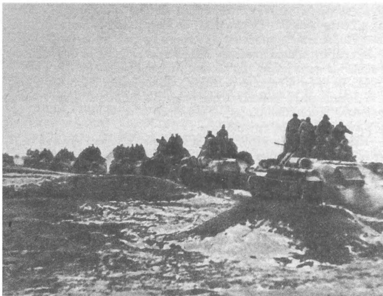
44-я гвардейская бригада на марше

Но дни, проведенные в этой должности, знаменательны для биографии нашего героя. Он принадлежал к тем, кто стал военным, чтобы на свете был мир, чтобы спокойно жилось мирным людям. И, наверно, поэтому долго помнили жители Казатина смуглого молодого полковника, к которому, не смущаясь, могла обратиться старушка с просьбой помочь подправить хату, грозившую рухнуть после очередной бомбежки, или другая — дать солдатиков креницу раскопать, которую засыпало.