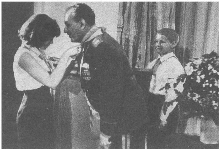
Принят в почетные пионеры

бадского района Нахичеванской АССР с аккуратно прикрепленной копией ответного письма маршала.