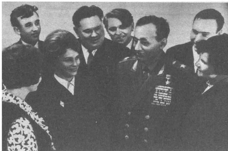
Встреча маршала А. Х. Бабаджяна с избирателями

институт, другого отправил в Евпаторию, а потом переписывался с ними, следил за их судьбой. Детей вообще очень любил, мог подолгу рассказывать о своих внуках — их у него было четыре; «мои любимые женщины» — шутил он.