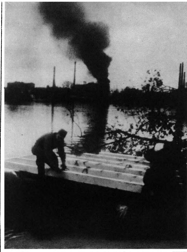
Через Шпрее. Танки форсируют реку